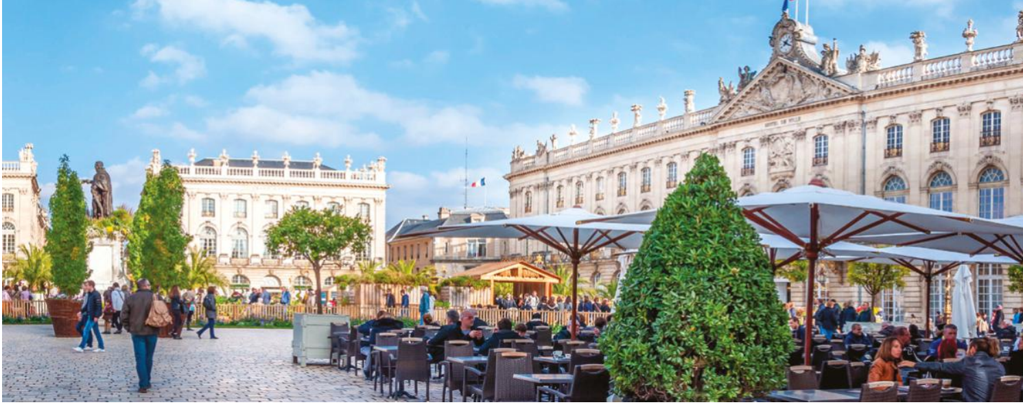
图：南锡市中心斯坦尼斯拉斯广场（被联合国教科文组织评选为“世界遗产”，也是欧洲最美丽的广场之一）